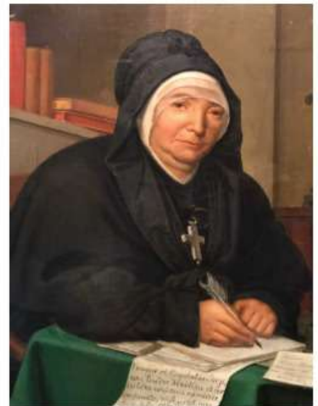
mayo de 2022 por el papa Francisco.

Finalmente se logra la canonización de Ana María Rivier el 15 de